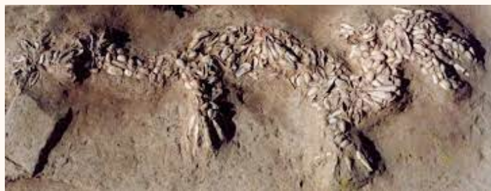
Photographie du dragon découvert à Xishui façonné il y a 6000 ans

Le dragon est une créature légendaire représentée comme une sorte de reptile gigantesque, ailes déployées et pattes armées de griffes. Le dragon a été repris dans la littérature moderne et le cinéma, ainsi que dans les jeux de rôle (essentiellement ceux d'inspiration médiévale-fantastique). Les premières descriptions connues des dragons sont celles des mythologies du Proche-Orient, en particulier dans l'art et la littérature mésopotamiens. Les plus anciennes traces connues de représentations du dragon remontent quant à elles à la Mongolie au Néolithique, et au IV e millénaire av. J. -C., dans une tombe néolithique de Xishui, site archéologique de la province du Henan, en Chine : formée de coquillages, sa forme se détache nettement aux côtés du défunt.